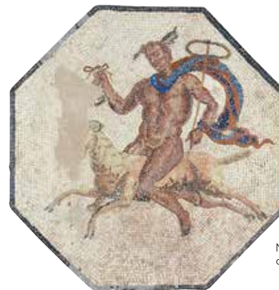
Mercurus, mosaïque des divinités, Orbe-Boscéaz

Samedi et dimanche à 11h et 15h, salle Colin Martin. Petit coup d'œil sur les pratiques monétaires et les échanges dans nos régions à l'époque romaine. Trouvailles anodines ou trésors découverts récemment vous en diront plus sur l'argent des Romains.